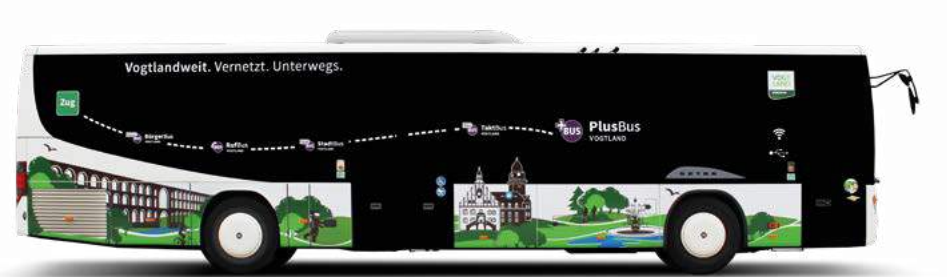
Lesedauer 5 Min.