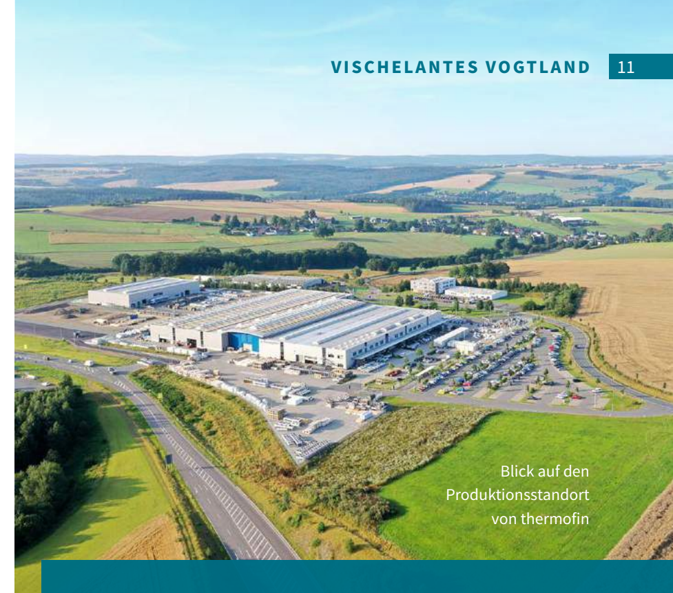
Blick auf den Produktionsstandort von thermofin

Mit dem Bus zur Arbeit. Fragen Sie Ihren Arbeitgeber nach einem JobTicket!