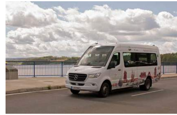
Staumauer Talsperre Pöhl

* Information zu den Saisonzeiten der Linie 74: Bis 30. April täglich als RufBus, mit Voranmeldung unter Servicetelefon 03744 19449. Ab 1. Mai gilt der Saisonfahrplan wie oben beschrieben.