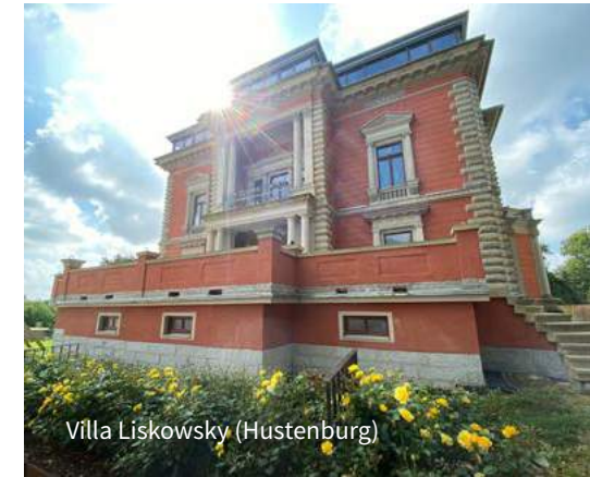
Villa Liskowsky (Hustenburg)