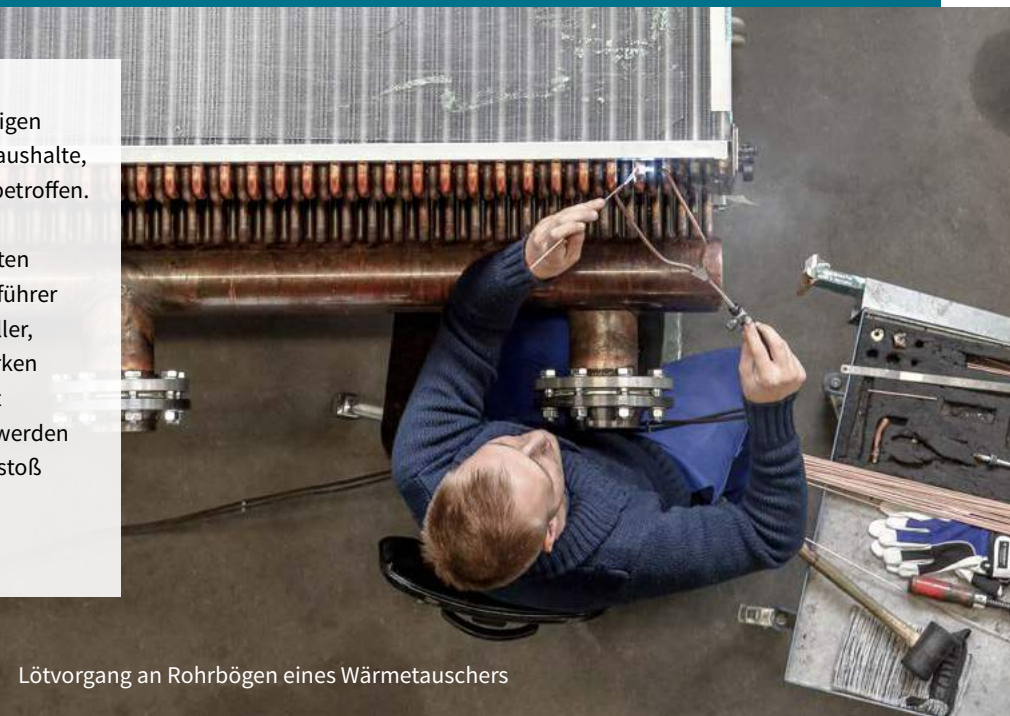
Lötvorgang an Rohrbögen eines Wärmetauschers